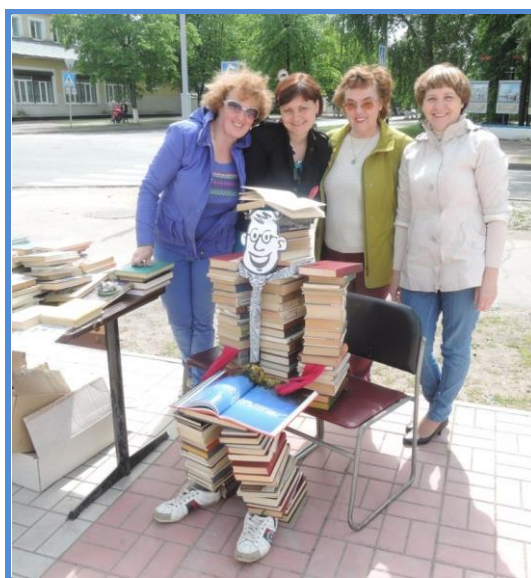
Книжный человек», сложенный из подаренных книг г. Лодейное Поле

Классический вариант буккроссинга, когда библиотеки, имеющие выход в Интернет, полностью соблюдают все условия этого книжного движения, в Ленинградской области распространен очень слабо.