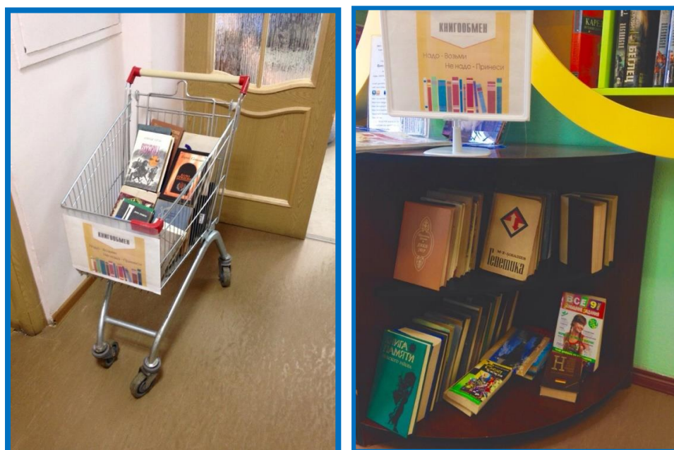
Библиокорзина и стеллаж в Центральной городской библиотеке г. Луги

В большинстве случаев в библиотеках Ленинградской области используется практика поддержки обычного обмена книгами между жителями по принципу: одни приносят свои книги, другие берут безвозмездно для чтения. Такой вариант буккроссинга существует почти во всех библиотеках Ленинградской области. Например, в Центральной библиотеке Ломоносовского муниципального района им. Н.А. Рубакина организован книжный фримаркет «Книги ищут дом». Это специально оформленный