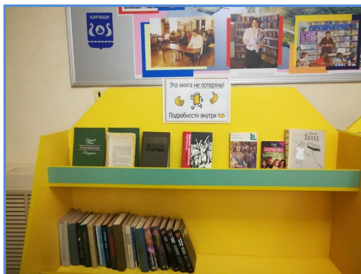
Стеллаж «буккроссинга» в Центральной Киришской библиотеке