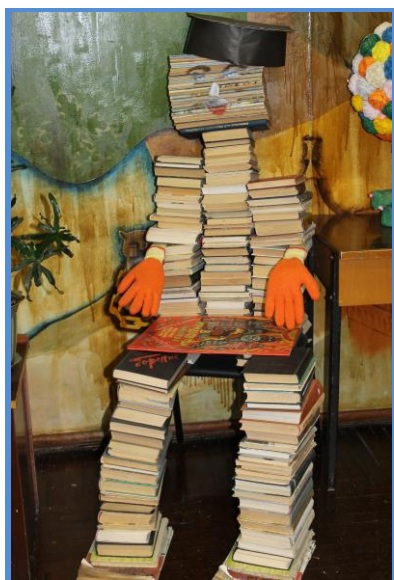
«Книжный человек», сложенный из подаренных книг г. Кингисепп

произведения современных авторов, а также специальная литература по самым различным темам. Ведь не у каждого жителя нашего города есть возможность приобрести новую литературу. У столов с подаренными книгами часто можно увидеть пенсионеров, которые с удовольствием выбирают книги. Пользуется этот проект популярностью и у молодых читателей – здесь они могут найти необходимую им учебную литературу. Креативно подошли к оформлению сотрудники Кингисеппской городской детской библиотеки №4 - в фойе можно увидеть настоящего «книжного человека», сложенного из подаренных книг, возле которого постоянно толпятся маленькие читатели. Ведь это так необычно и интересно! Интересный и смешной «книжный человек» получился и сотрудников библиотек в городе Лодейное Поле.